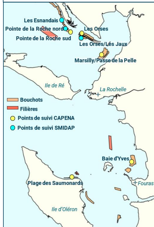
Situation géographique des points de prélèvement de corde dans les pertuis charentais et vendéen.